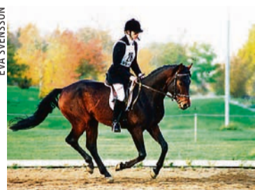
Bästa ridponnyhingst i tabellen är halvblodet Minotauros RP 114 (e Little Boy-Ciceron) på 13:e plats totalt, men sexa i hoppning. Bilden togs vid hans bruksprov 1994.