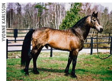
Poetic Justice RC 81 (e Ballydonagh Cassanova-Carna Bobby) klättrar vidare på listan – från åttonde till sjätte plats totalt med 45,90 procent tävlande avkommor.