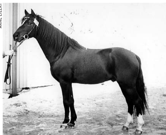
Dito RW 75 (e Greatworth Swordsman) har överlägset högst andel avkommor som tävlat i högre klasser. Så här såg hingsten ut 1987.